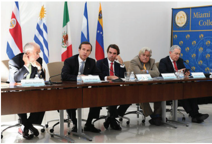
PARTE DEL PANEL QUE PARTICIPÓ EN EL PRIMER DIÁLOGO PRESIDENCIAL. (ÁLVARO MATA)