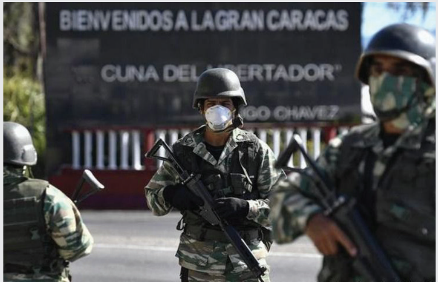
EN VENEZUELA EL RÉGIMEN DE NICOLÁS MADURO ENFRENTA LA CRISIS DEL CORONAVIRUS IMPLEMENTANDO LA FUERZA MILITAR PARA MANTENER EL CONTROL SOBRE LA POBLACIÓN.